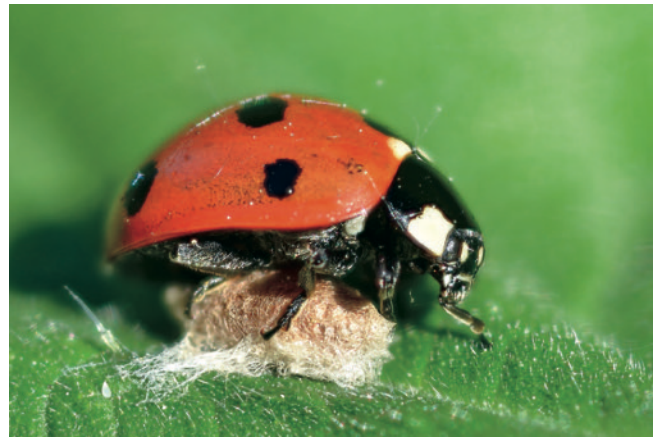
益虫であるテントウムシがスズメバチの幼虫の宿主となることもある。

捕食者と害虫の関係については多くの研究がなされており、生物多様性が低いシステムは害虫の発生に対して特に脆弱であることが明らかになっています。私たちの菜園でも、このような事態を避けるようにしなければなりません。私は自分の栽培区画で、さまざまな種類の害虫を捕食する多様な益虫を引き寄せるために、モザイク状の生息地を作ることを目指しています。この10年