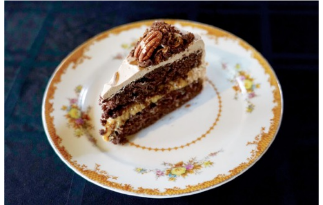
ザウアークラウトをチョコレートケーキに加えると、驚くほどおいしく（栄養価も高く！）なる。

しかし、発酵は一元的な技術ではなく、さまざまなプロセスを含み、どの食物が豊富なのか、どんな気候なの