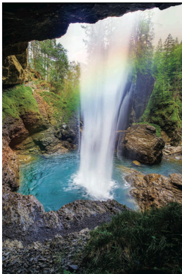
(上から時計回り) イリノイ州のマイドウィン・ナショナル・ツールグラス・プレーリーで、南下するオオカバマダラが、夜には木を埋め尽くし、日の出に目を覚ます。スイスのベルグリステューバーの滝に広がる虹。フロリダ州ダニーデンの池の岸辺に上がってきた6羽のマガモの子。