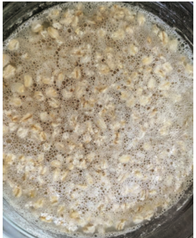
伝統的な穀物発酵の人気は衰えましたが、栄養価が高く、簡単に作ることができます。

(kisla) とも呼ばれ、バターや脂肪と一緒に熱いうちに食べたり、後には冷たいゼリーとして食べたりもしま