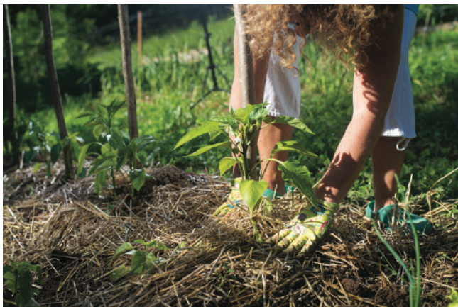
植え床の土を露出しないこと。常に次の展開を考え、適宜計画。

ジョニー・アップルシード・オーガニック・ビレッジ（Johnny Appleseed Organic Village）はフロリダ州ジャクソンビル近郊にある15エーカー（6ha）の実験的研究施設です（現在も拡大中！）。パーマカルチャー、シントロピック・アグロフォレストリー、バイオダイナミック農法を組み合わせた革新的な栽培方法である気候対応農法を実践し、健康で活気のある作物を育てながら、炭素を土に還元することを目的としています。私たちはこれらの技術を発明したわけでは無く（詳しくは、 www.MotherEarthNews.jp/climate-farming-s-indigenous-roots/ の「先住民族に根づく気候対応農法」をご参照）、これらを組み合わせで独自のシステムを作りました。このシステムには、天然資源