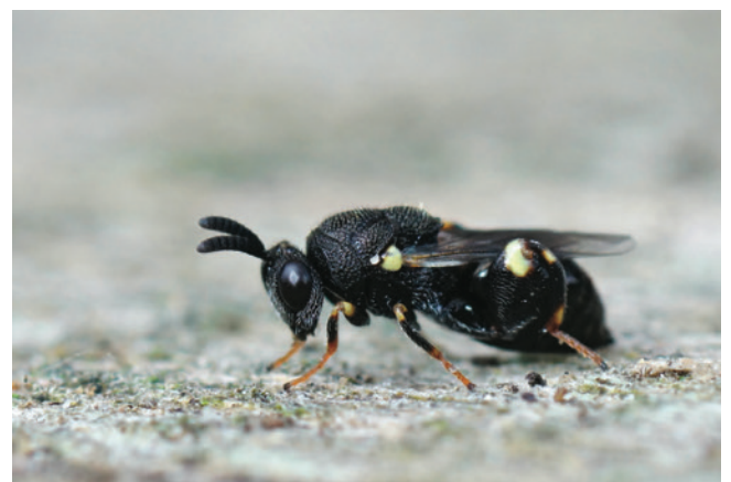
寄生性のヤドリバエ科 [学名：Tachina grossa]（上）、コバチ上科 [学名：Chalcidoidea]（下）。