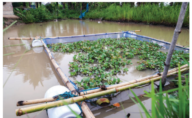
生簀網養殖は、最も手頃な裏庭の養殖方法の一つ。