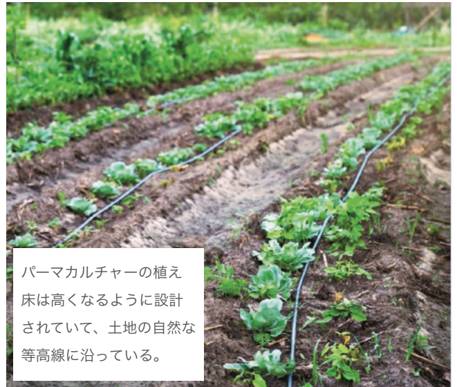
パーマカルチャーの植え床は高くなるように設計されていて、土地の自然な等高線に沿っている。

を枯渇させるのではなく、補いながら地球を持続的に豊かにする力があると考えています。