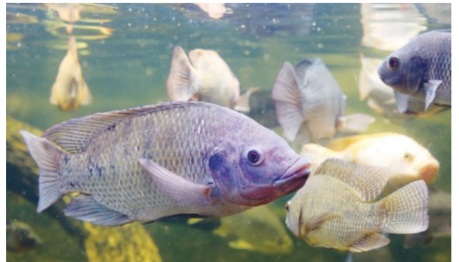
レッドティラピア（オレオクロミス属）

これまで養殖には悪評のようなものがありました。というのも、養殖は大規模な商業施設に限られ、大量の水とエネルギーを必要とするため、大きな公害の原因となり得るからです。それに対して、ヴァン・ゴダーのシ