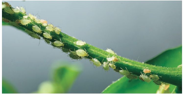
寄生蜂はイモムシなどの宿主の体内で成長する（左）。これらの捕食者などが、害虫（右）から菜園を守ってくれる。

注意しなければならないことがあります。獲物がたくさんいる場合、すでに捕食者の数が増えている可能性が高いのです。捕食者の数が獲物の数に比べて遅れてしまうからです。もし、薬剤散布の誘惑に駆られたら、獲物と捕食者の両方を殺して、自然のサイクルを破壊してしまうことになり、自然のコントロールを取り戻すチャンスはなくなるでしょう。できることなら、辛抱強く、自然の成り行きに任せ、捕食者が「動き出す」のを待ちましましょう。もし待てない場合は、植物に捕食者がいるかどうかをよく確認してから、オーガニック製品（あるいは、ただ自分の指先）を使って害虫を駆除したり、押しつぶしたりしてください。