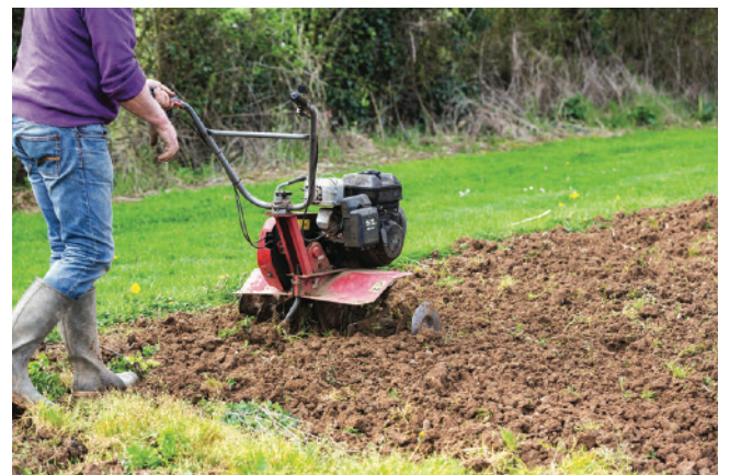
耕すことは、土をほぐしてすぐにガーデニングを始める方法の一つ。

耕す。 すぐに始めるには、従来の四輪または二輪のトラクターを使って、草刈りをした後、土を耕し、植物の