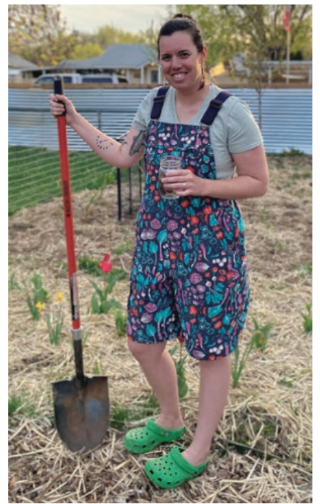
上の写真。トレジャー・バレーでは、シェイファー・ビュートの雪が消えたら植物を植えるというのが常識になっている。右の写真：初夏の菜園にいる筆者。

た。敷地の両端には木が一本ずつ立っていますが、低木や灌木は1本もなく、草だけです。引っ越してから3週間は、蜂を見かけませんでした。