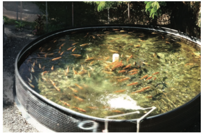
水耕栽培と養殖を組み合わせた温室アクアポニックス（左）、庭のホースさえあればできる再循環式の養殖（右）。